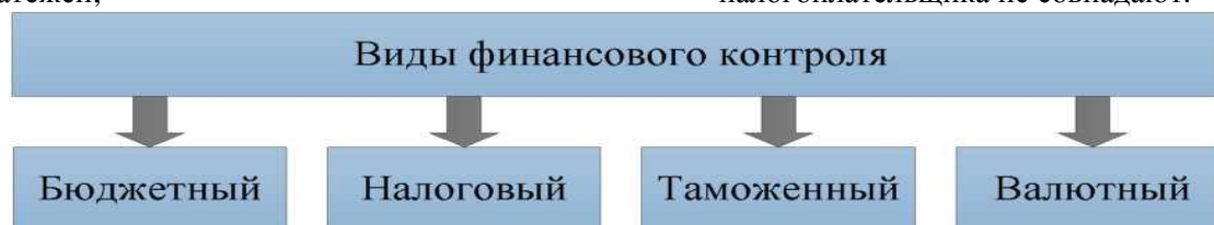
Рисунок 1 - Виды государственного финансового контроля Примечание составлено по материалам источника[2, с. 124]

Пристальное внимание к налоговому контролю связано с тем, что налоги являются если и не главным, то основным источником наполнения бюджета, а налоговые правоотношения изначально конфликтны. Задачам государства, связанным со сбором налогов, противостоит естественное стремление налогоплательщика предельно уменьшить размер налоговых платежей. В связи с чем интересы государства и налогоплательщика не совпадают.