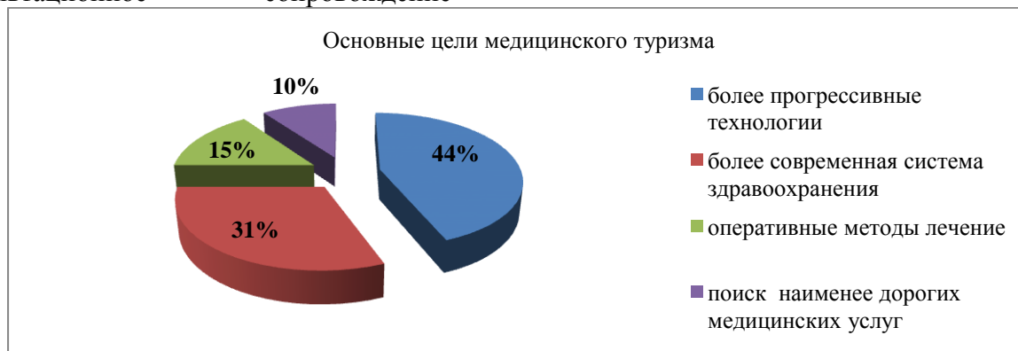
Рисунок 1 -Целевые направления медицинского туризма

Согласно данным Euromonitor International основные цели медицинского туризма в долевым соотношении можно представить следующим образом (рисунок 1):