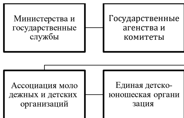
Рисунок 2 – Модель государственно-частного партнерства на республиканском уровне

Организация государственного-частного партнерства на республиканском уровне является более сложной задачей.